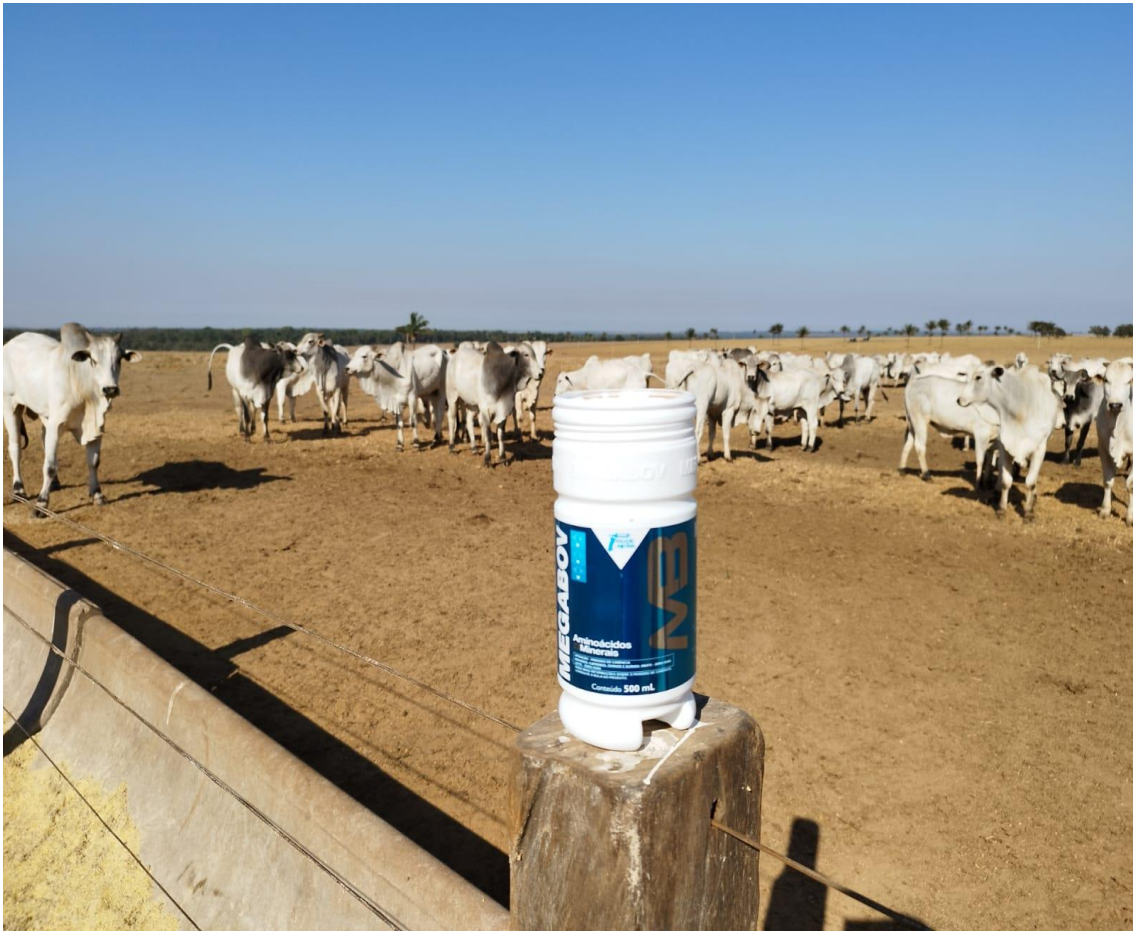
Visita de acompanhamento 31/07/2022.