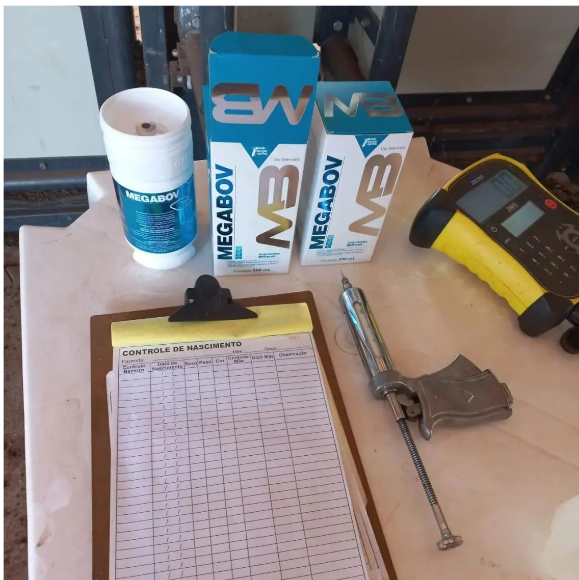
19/05/2022 pesagem dos animais (testemunha) e (MegaBov).

O segundo lote de animais ( MegaBov ), apresentou um peso médio de entrada de 476 kg (pasto 02), iniciou a dieta recebendo 3 kg dia de ração por animal e finalizou com 8 kg dia.